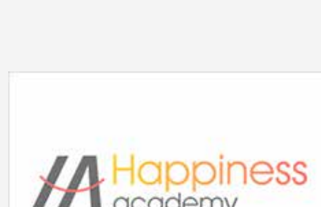
Happiness Academy / Bulgaria www.happinessacademy.eu