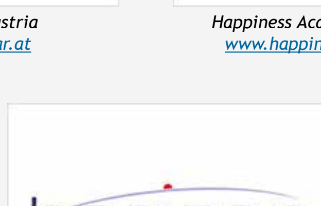
Horizon Software Solutions / UK www.horizont.co.uk

Manténgase al tanto de nuestras próximas actividades visitando la página web del proyecto